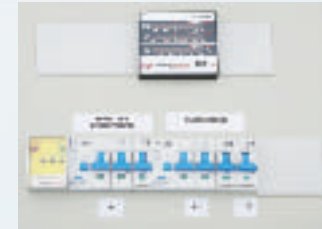
bei ZG- (10-31,5 kVA) mit Betriebsartenwahlschalter