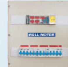
bei ZGPE- (27-60 kVA) mit automatischer Umschaltung