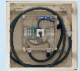
Optional: Notstrom-Einspeisestation CE konform entsprechend Niederspannungsrichtlinie 2006/95/EWG